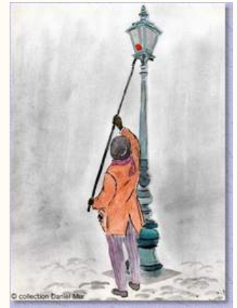
Collection Daniel Mur

Le village languedocien de La Garriga va se mettre en place à la salle Pétrarque. Une véritable histoire de passion, notre village met en scène, au fil des ans, les différentes étapes du développement de l'habitat rural dans le Languedoc Méditerranéen, depuis une simple bergerie en garrigue jusqu'à un village complet. Présentation de l'architecture de notre région, mais aussi représentation des vieux métiers, des danses traditionnelles et des costumes.