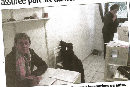
■ Un accueil chaleureux tous les matins pour inscriptions ou autre.

Ville accueillante s'il en est, La Grande-Motte en a séduit plus d'un... Certains touristes ont succombé à son charme en devenant "résidents".