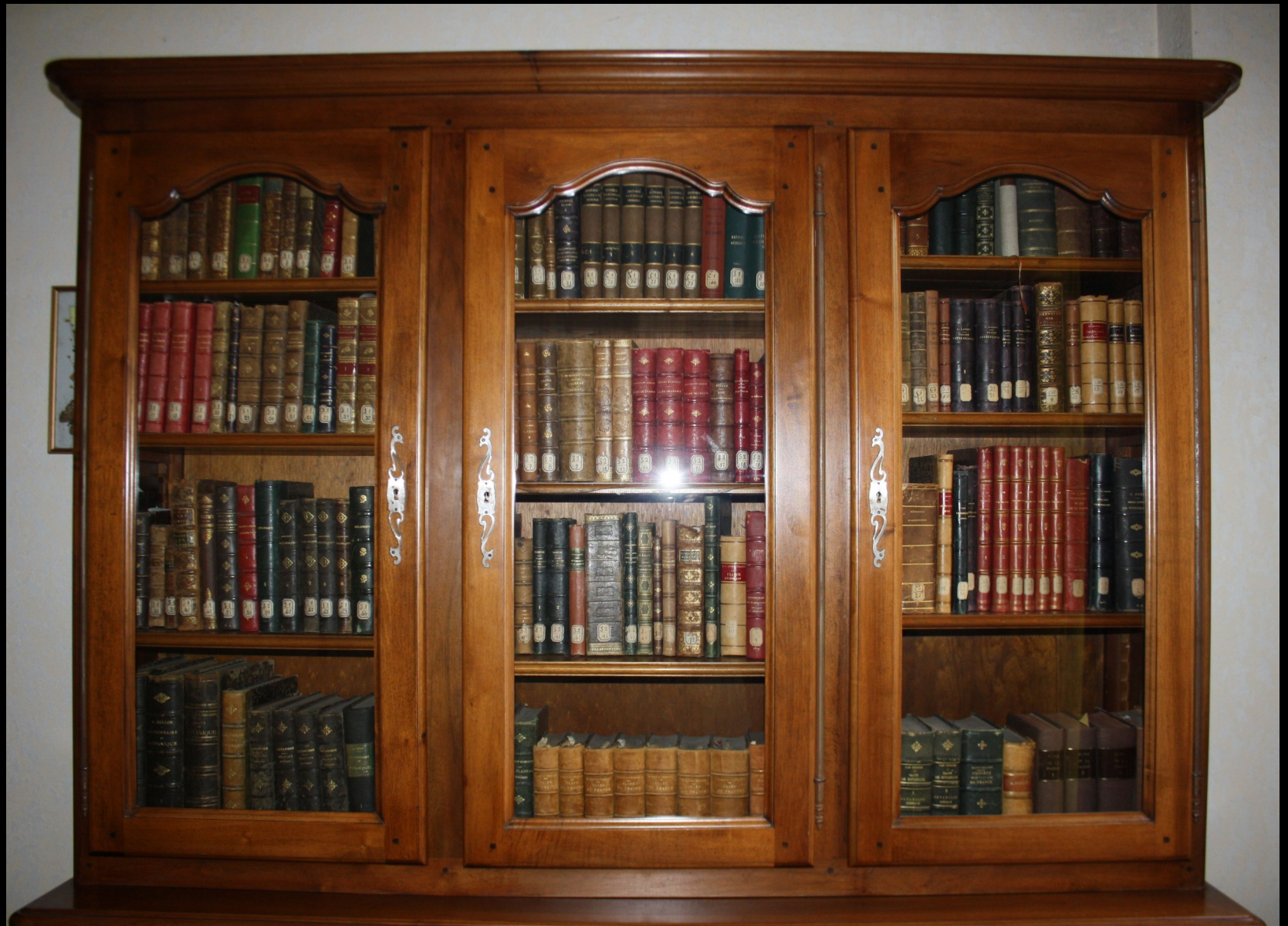
Le meuble bibliothèque où sont conservés les livres du fond ancien