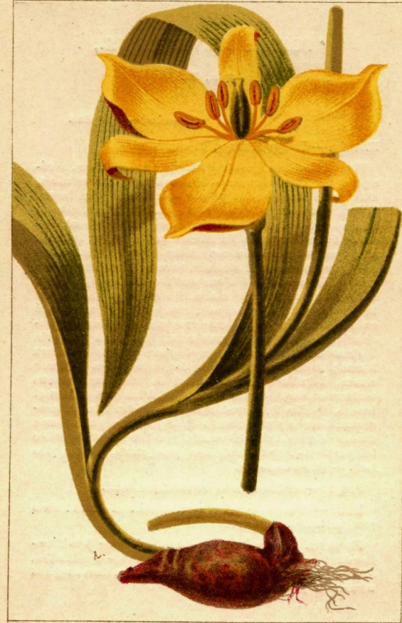
TULIPA SYLVESTRIS L. — TULIPE SAUVAGE.