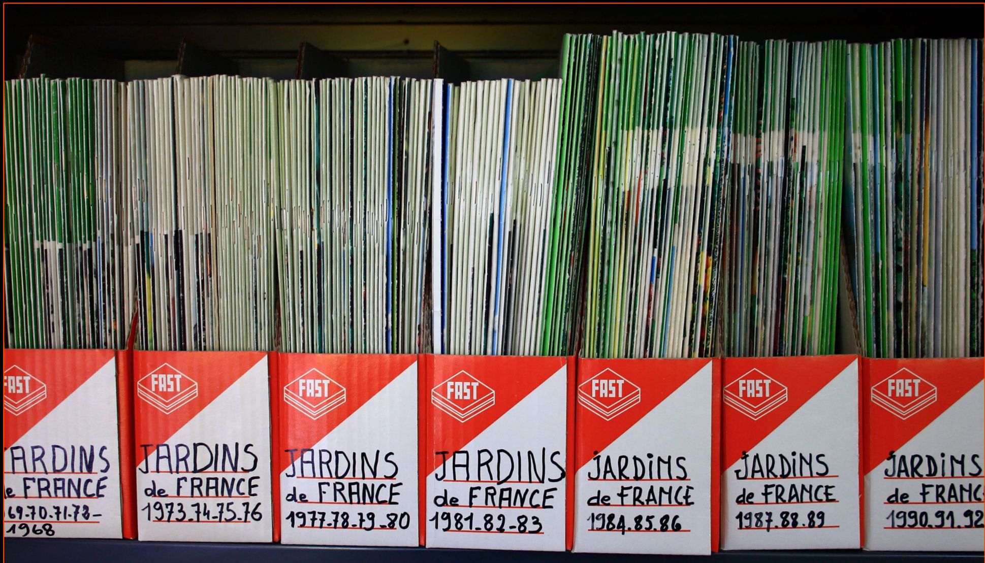
JARDIN de FRANCE, une des publications reçues par abonnement