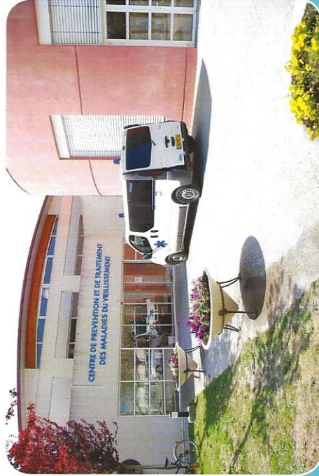
Unité de soins de longue durée Antonin Balmès