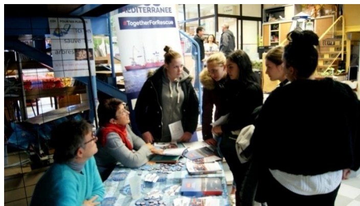
Débat et ateliers participatifs sur « Climat : le changement c'est nous !! » avec la transition énergétique comme mode de vie individuel et collectif à expérimenter et promouvoir