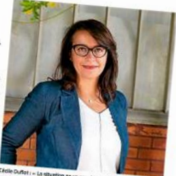
Cécile Duflot. « La situation ne va pas du tout dans le bon sens ».

L'ancienne ministre de François Hollande et députée écologiste est désormais présidente d'Oxfam France. Elle débat, ce jeudi soir, à la salle Rabelais, de l'impunité des multinationales.