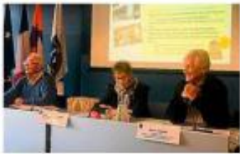
Les promoteurs de l'éclairage, ce mercredi, à l'hôtel de ville.