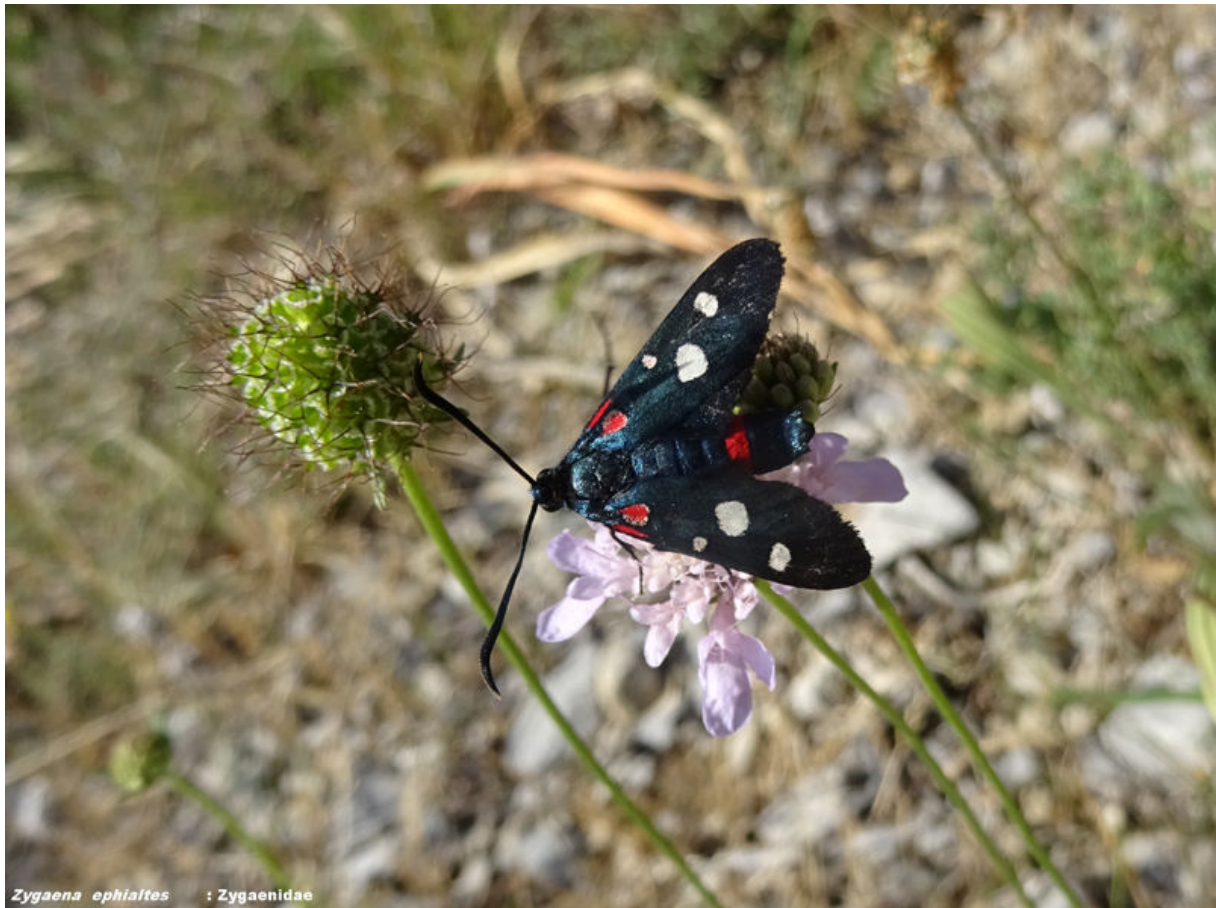
Zygaena ephialtes : Zygaenidae

Zygaena ephialtes - Zygaenidae Auteur : Marcelle Huguet Lieu : Les Lavagnes 02-07-2020