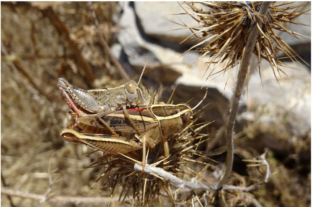
Lieu : Les Lavagnes 02-07-2020