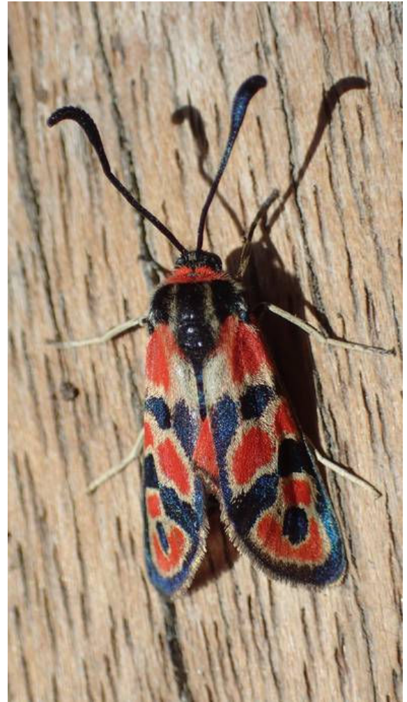
Zygaena fausta - Zygaenidae Adulte et chenille

Auteur : Frédéric Andrieu Lieu : Lunel-Viel (34) 02-06-2020 Sur Coronilla glauca (la plante hôte)