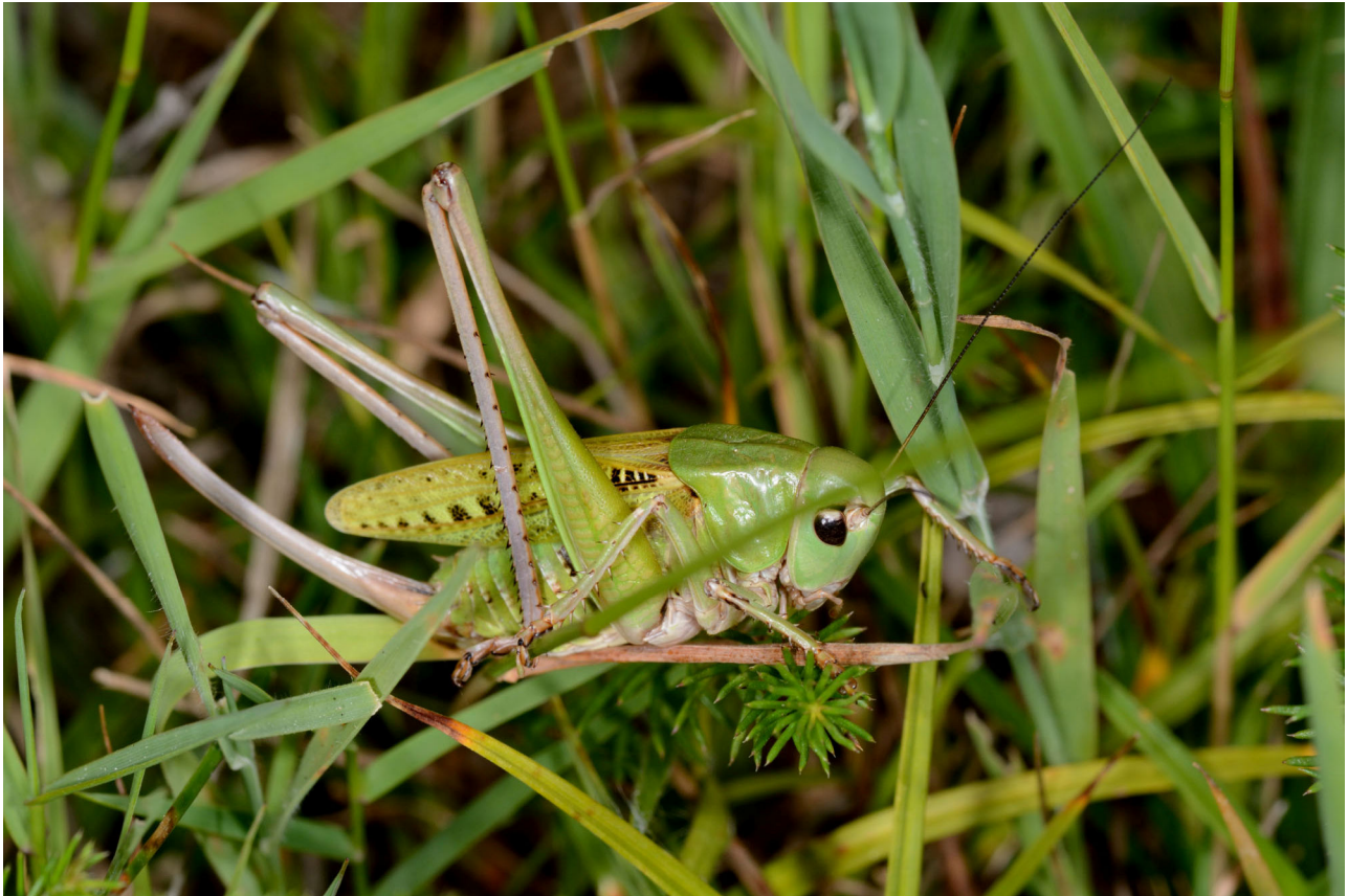
Decticus verrucivorus - Tettigoniidae Lieu : Lac des Pises (Dourbies-30) 01-07-2020