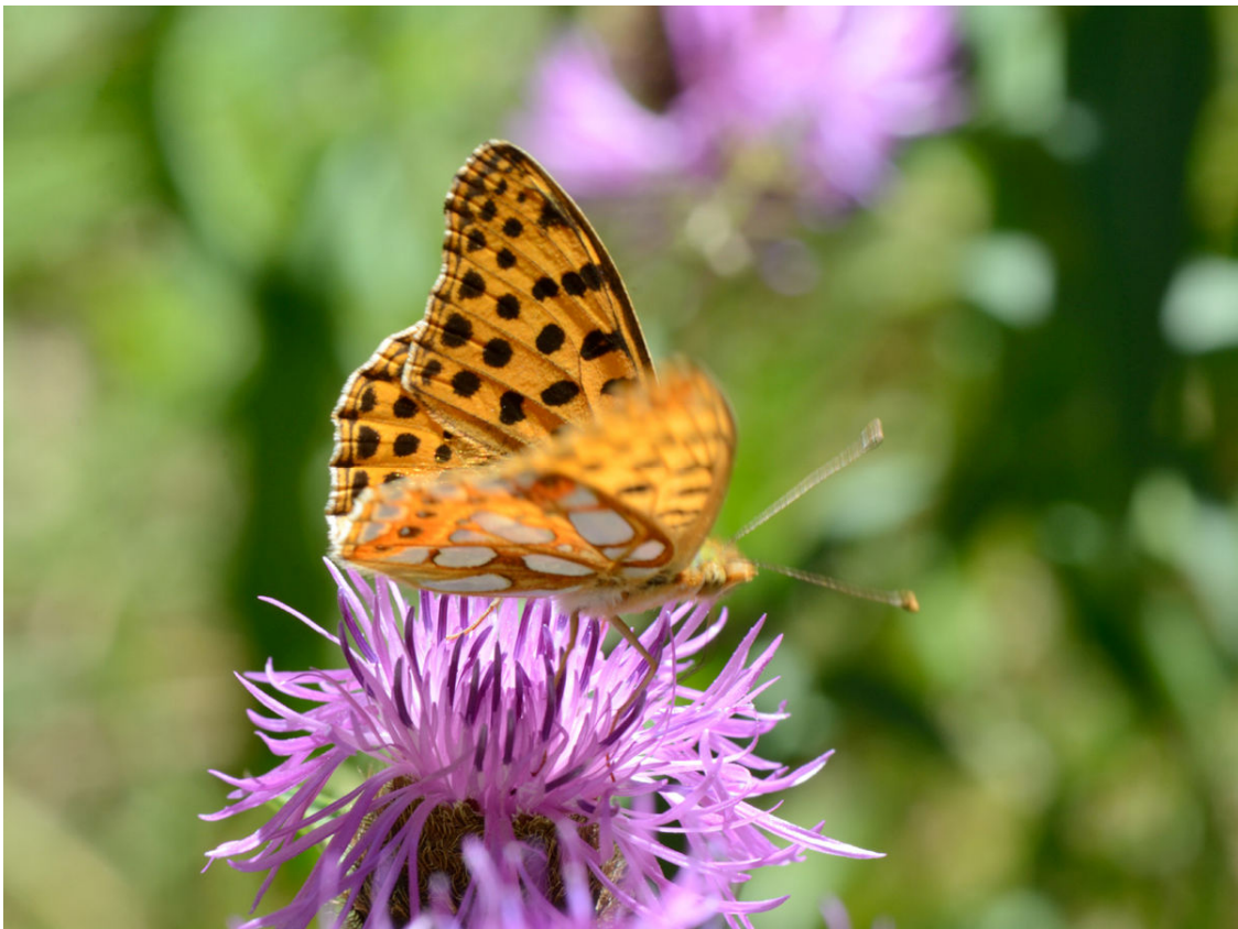
Issoria lathonia - Nymphalidae Le Petit Nacré Lieu : Lac des Pises 19-07-2020

Les 2 espèces volent en mélange dans les mêmes endroits et sur les mêmes fleurs : les taches nacrées du dessous de l'aile postérieure les distinguent.