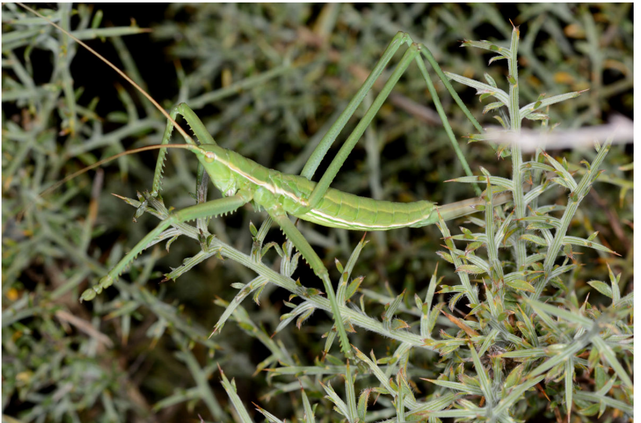
Saga pedo - Tettigoniidae La Magicienne dentelée Lieu : Notre Dame de Londres 22-06-2020