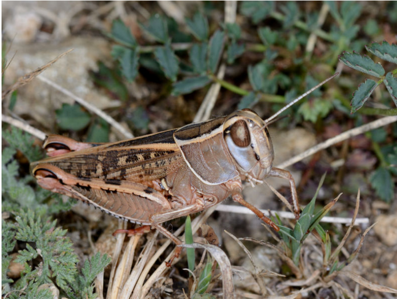
Lieu : Notre Dame de Londres 22-06-2020