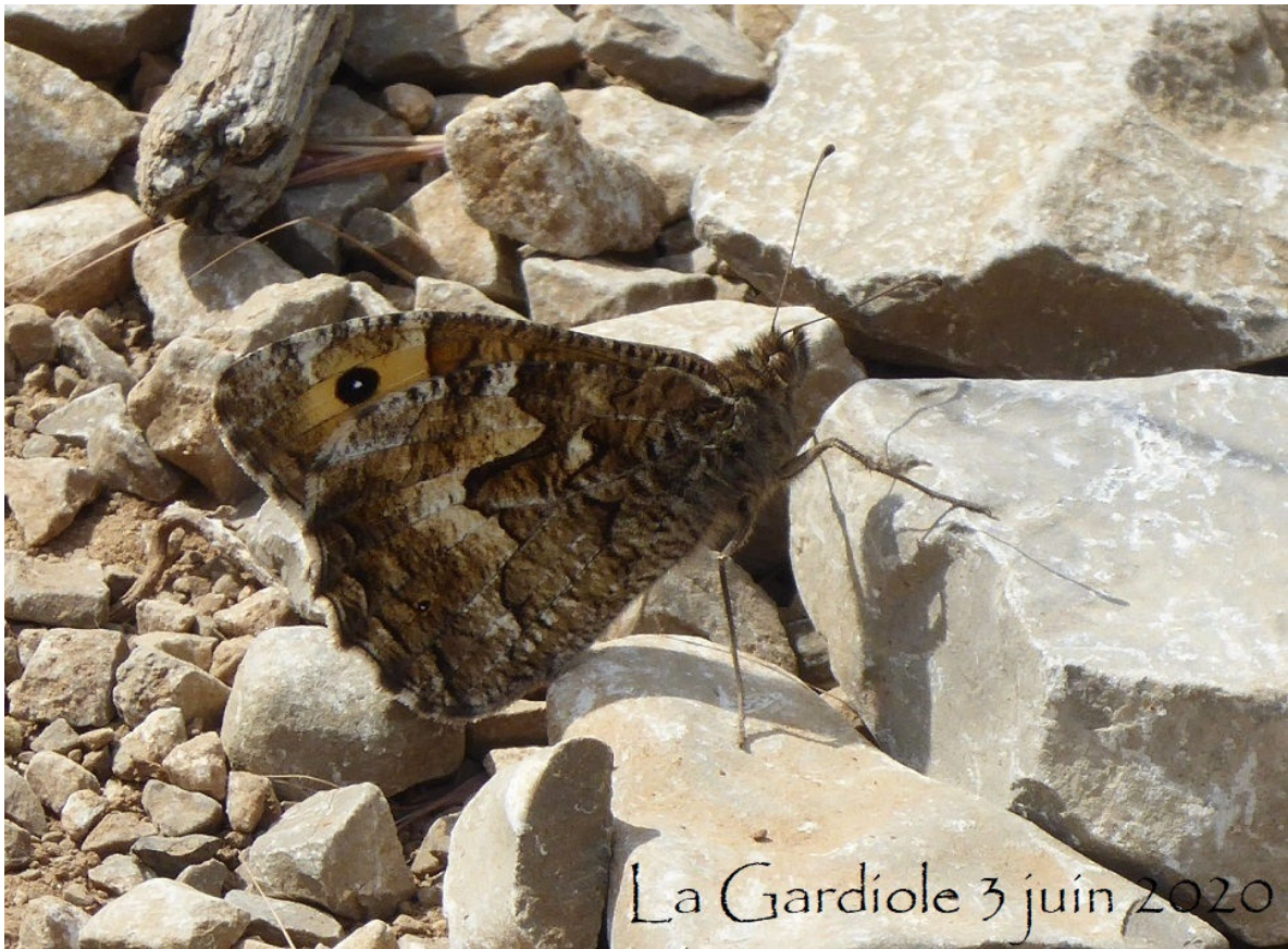
Hypparchia semele - Nymphalidae L'Agreste Lieu : La Gardiole 03-06-2020