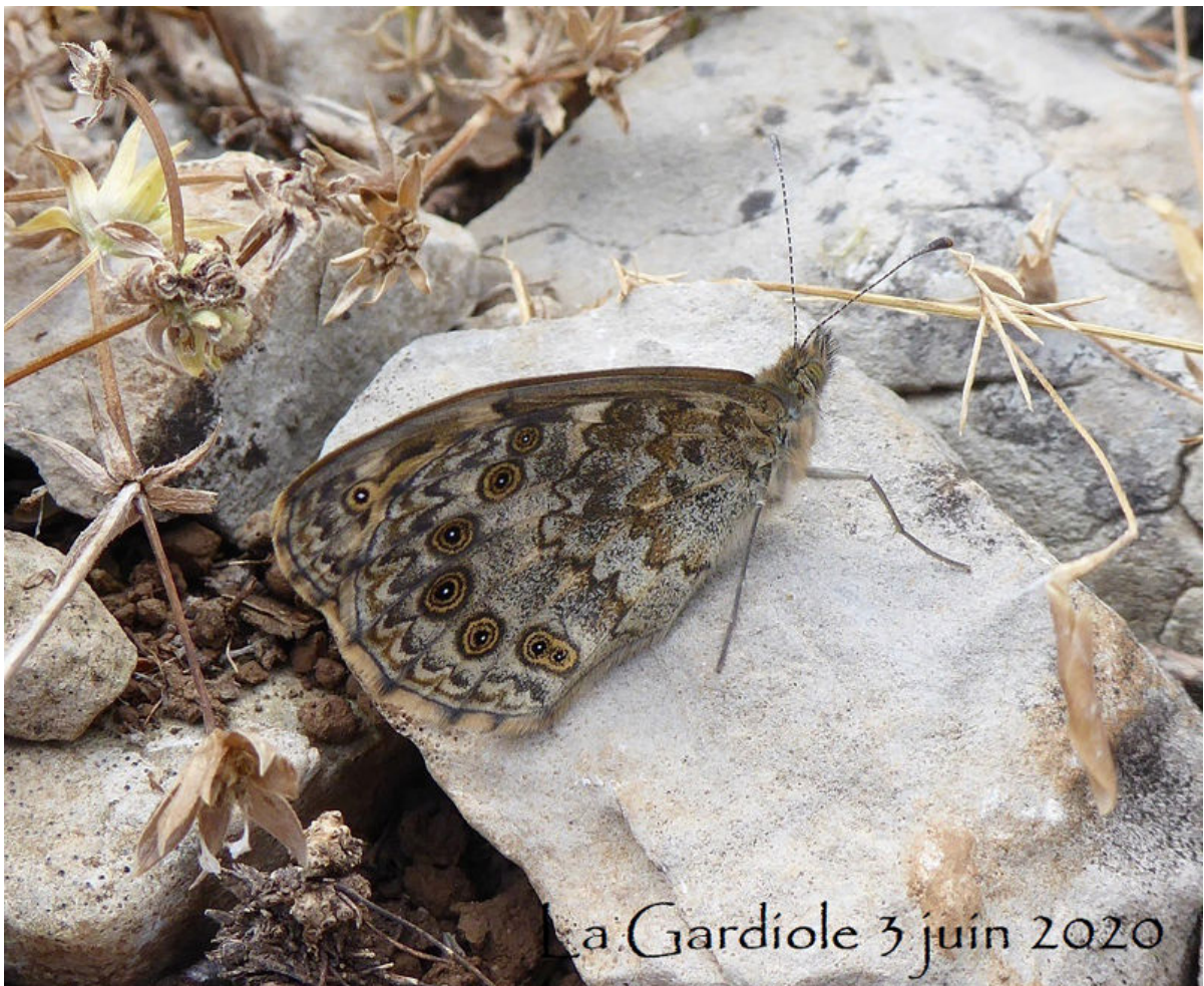
Lasiocoma megera - Nymphalidae La Mégère Lieu : La Gardiole 03-06-2020