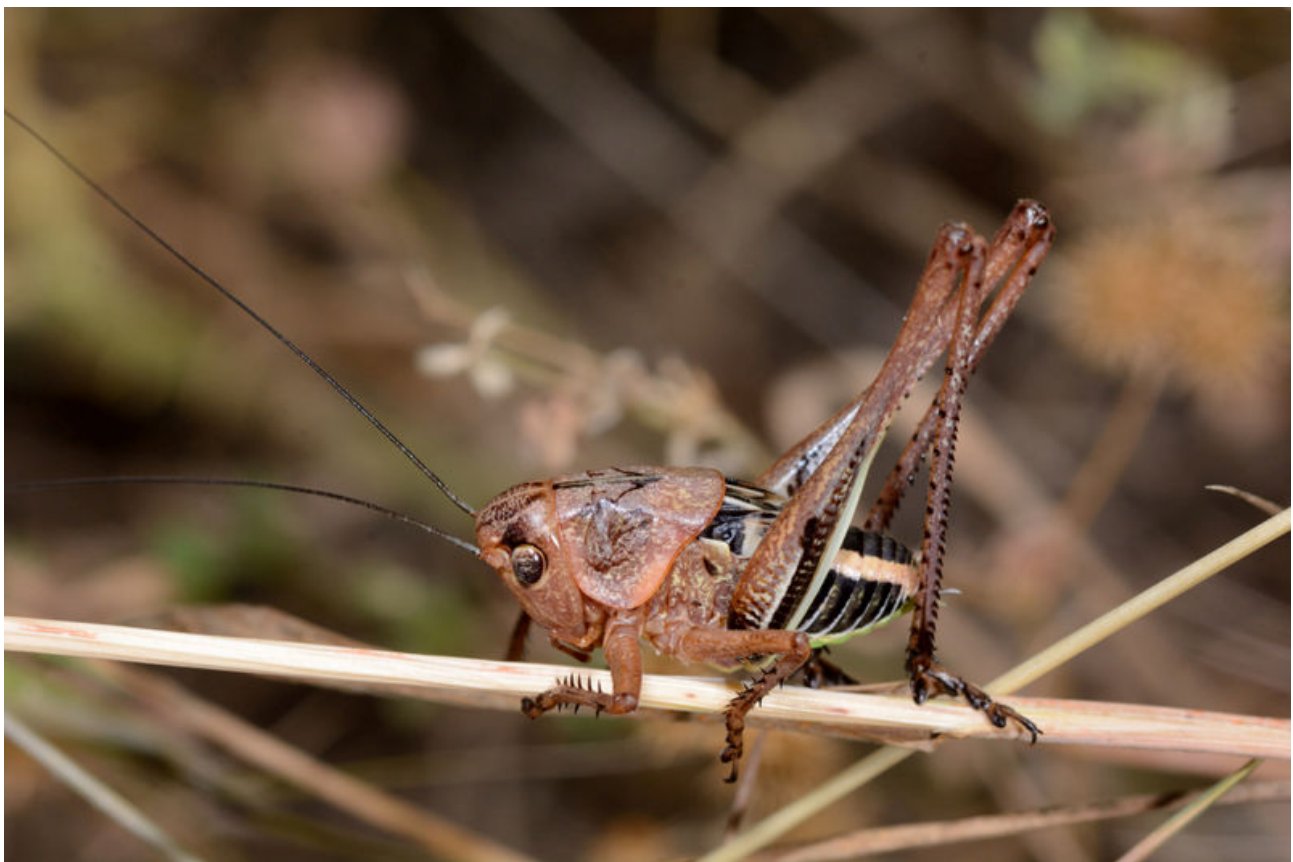
Decticus albifrons - Tettigoniidae Juvénile Lieu : Lac des Pises (Dourbies-30) 01-07-2020