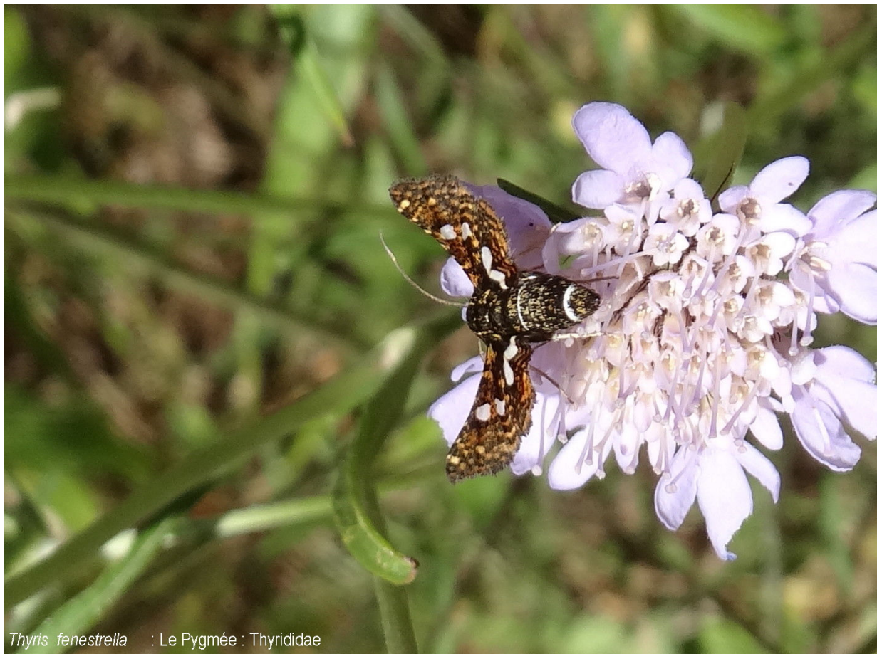
Thyris fenestrella : Le Pygmée : Thyrididae

Zygaena ephialtes - Zygaenidae Auteur : Marcelle Huguet Lieu : Les Lavagnes 02-07-2020