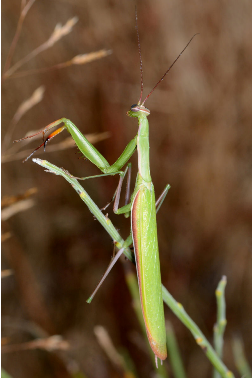
Mantis religiosa - Mantodea – Mantidae Mâle Lieu : Rosis (34) 29-07-2020