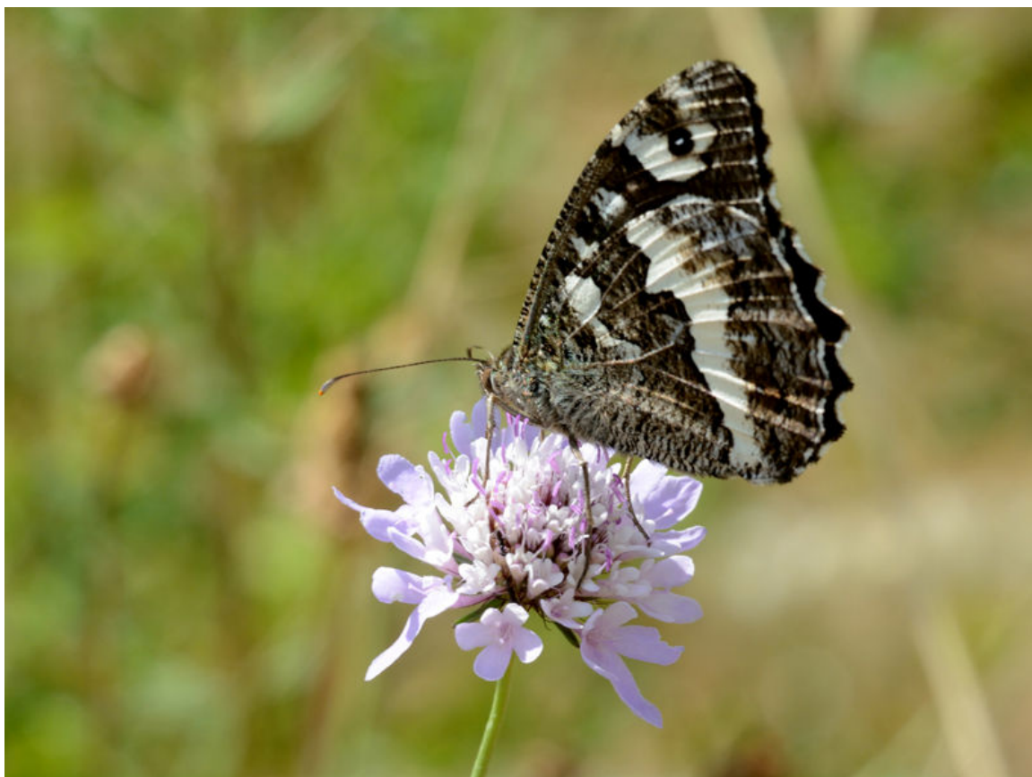
Brintesia circe - Nymphalidae Le Silene Lieu : Viols en Laval 11-06-2020