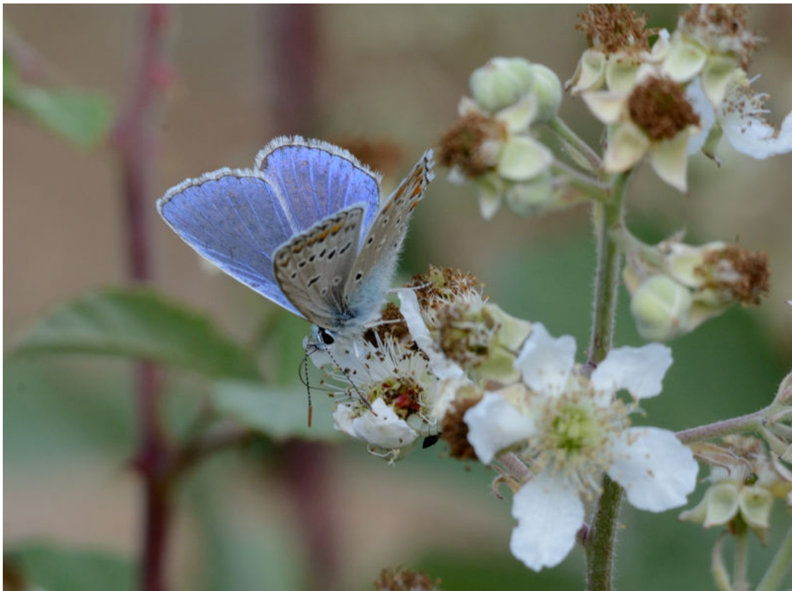
Polyommatus icarus - Lycaenidae L'argus bleu Lieu : Viols en Laval 11-06-2020