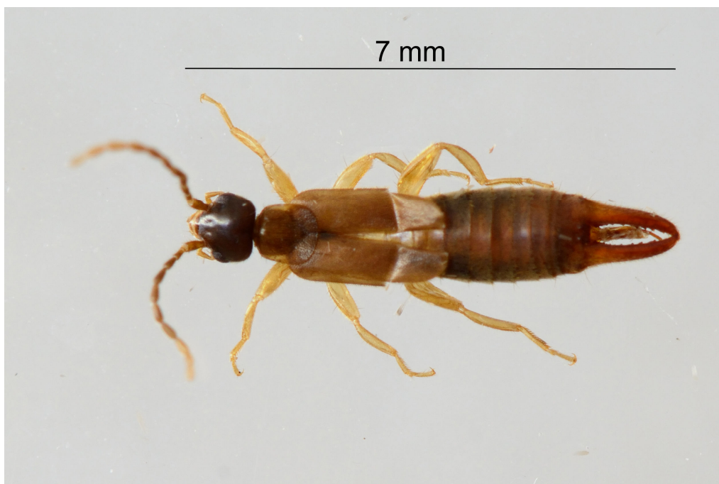
Labia minor Spongiphoridae - Dermaptera

Le Forficula n'est pas le banal auricularia, mais F. decipiens , mâle, une des 3 petites espèces du genre dont les ailes ne dépassent pas des élytres, plus rare que F. pubescens en Languedoc ; le 3ème est limité à l'ouest de la France. Chez auricularia les ailes sont visibles ; petit triangle jaune dépassant des élytres. (Didier Morin)