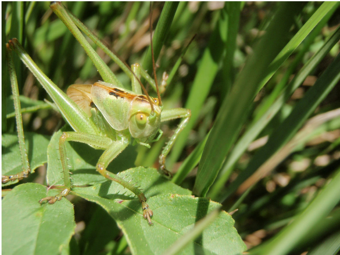
Tettigonia viridissima - Tettigoniidae Juvénile

Auteur : Micheline Blavier Lieu : StThibéry 09-05-2020