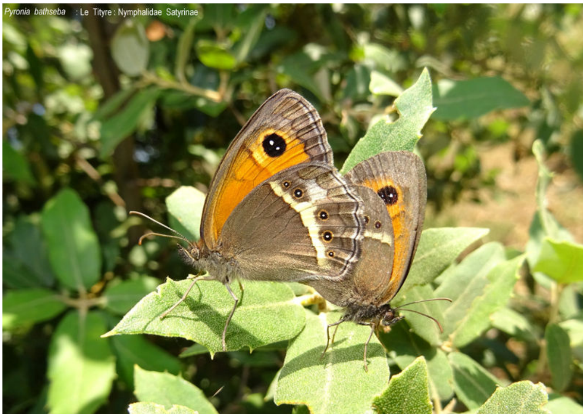
Pyronia bathseba : Le Tityre : Nymphalidae Satyrinae