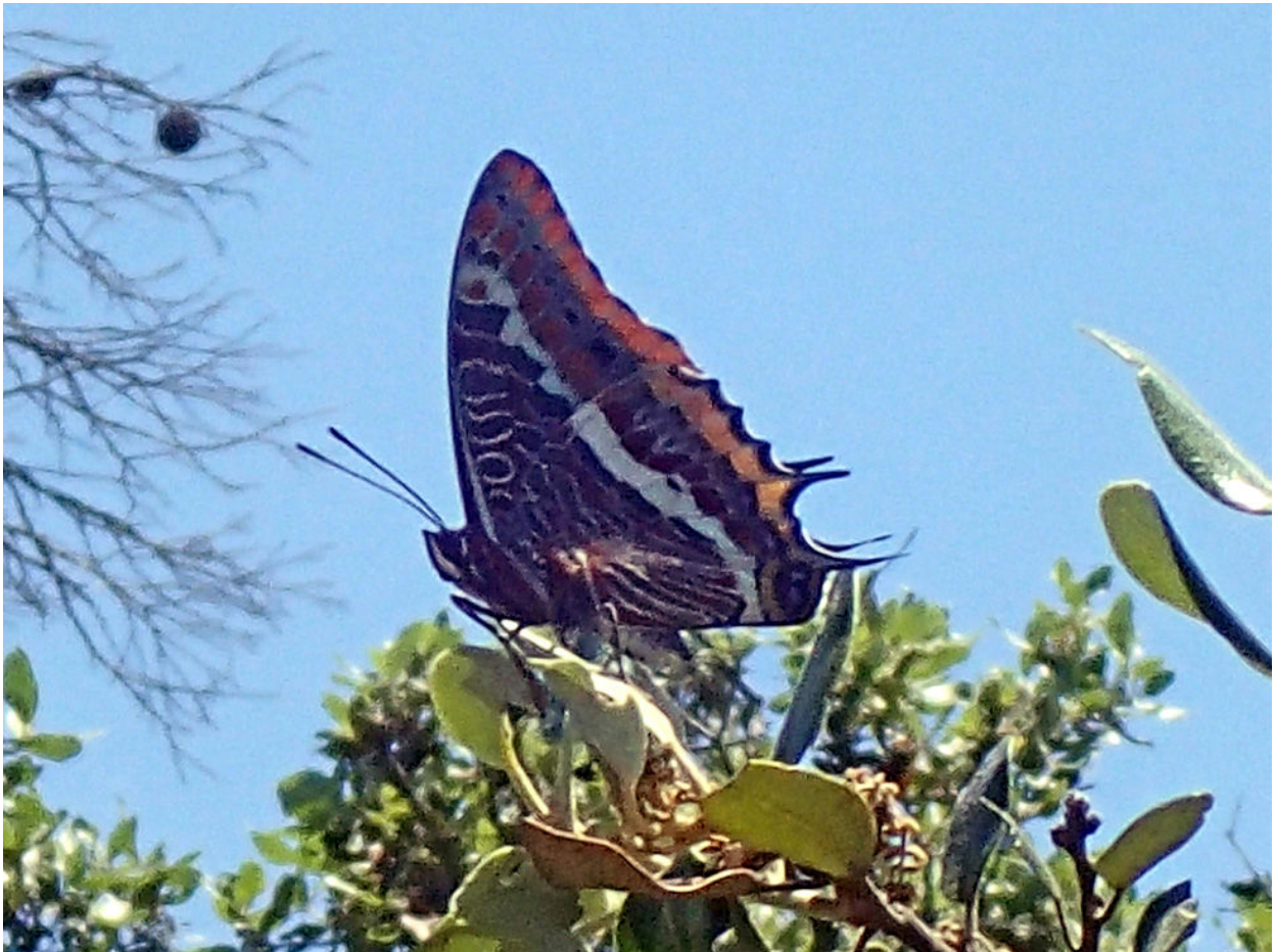
Charaxes jasius - Papilionidae Pacha à 2 queues Auteur : DidierBasset Lieu : Claret 02/06/2020