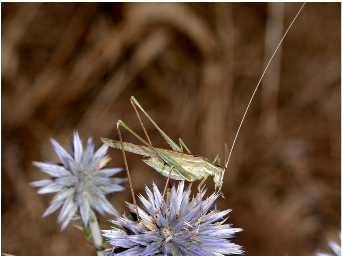
Tylopsis lilifolia - Tettigoniidae

Auteur : Gérard Labonne Lieu : Notre Dame de Londres 21-07-2020