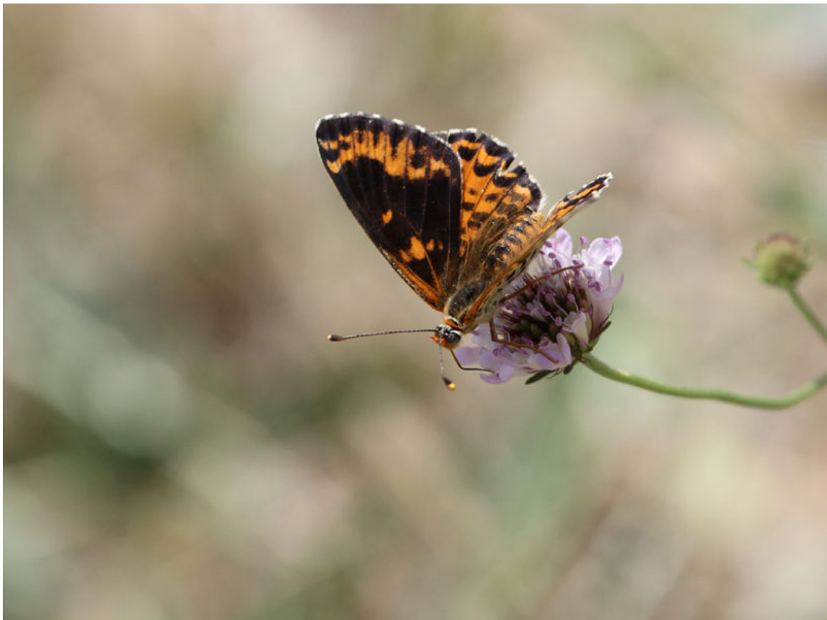
Melitaea dydima - Nymphalidae Avec une coloration aberrante Lieu : Bord du Vidourle 16-06-2020