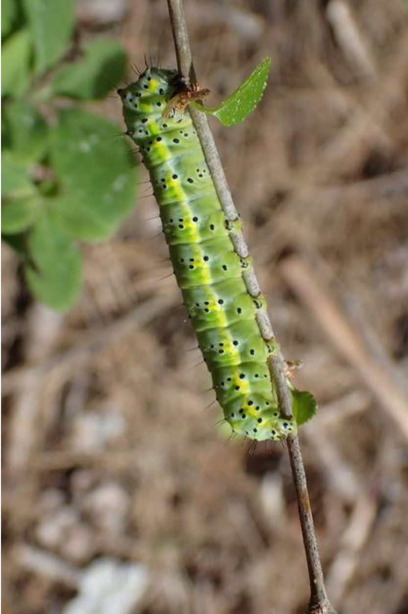
Diloba caeruleocephala Noctuidae