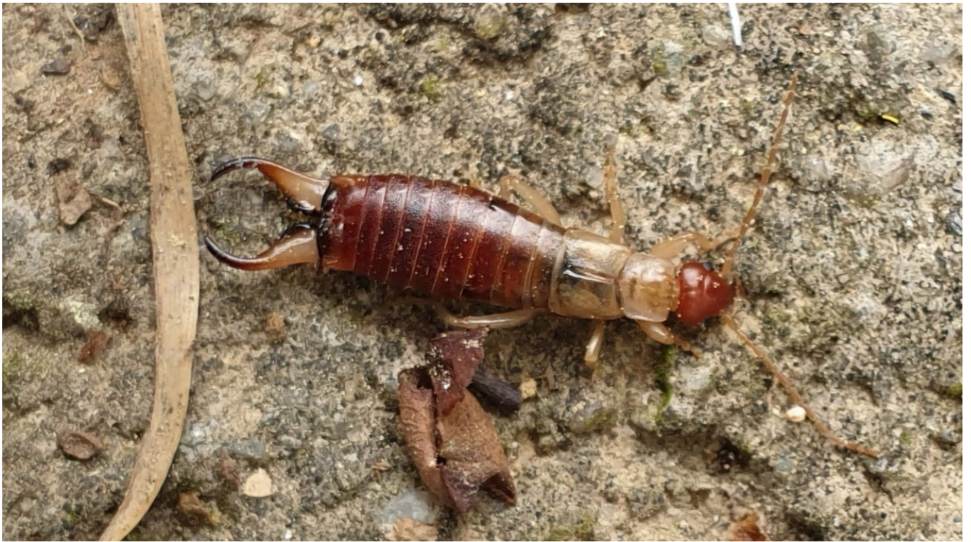
Forficula decipiens - Forficulidae – Dermaptera

Il n'y a pas que le perce-oreille commun ( Forficula auricularia ) : nous avons 20 espèces présentes en France. En voici 2 : une très proche de F. auricularia : F. decipiens et une toute petite : Labia minor