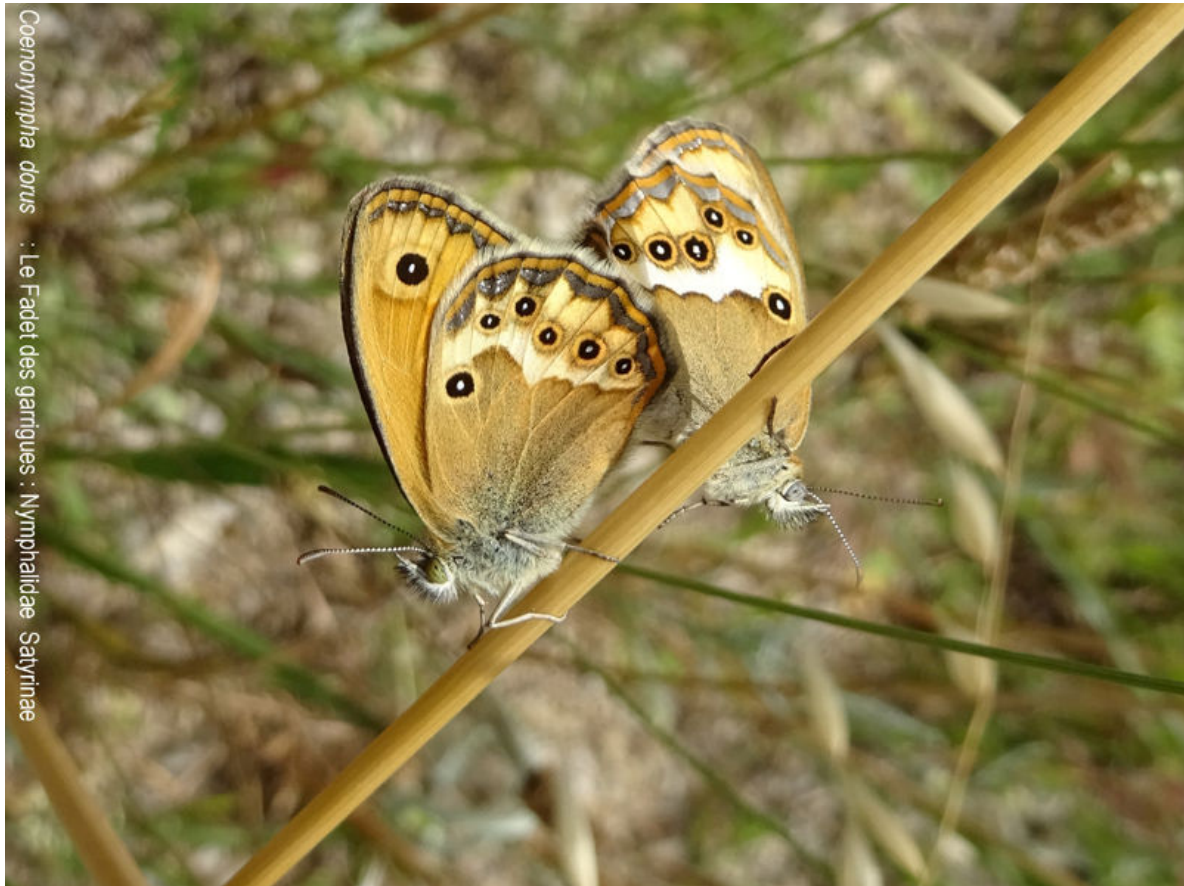
Coenonympha dorus : Le Fadet des garrigues : Nymphalidae Satyrinae