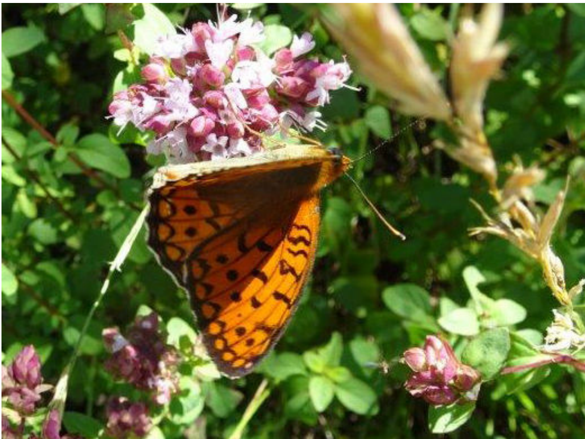
Argynnis aglaja - Nymphalidae Le Grand Nacré Lieu : Madières sur Origan 15-06-2020