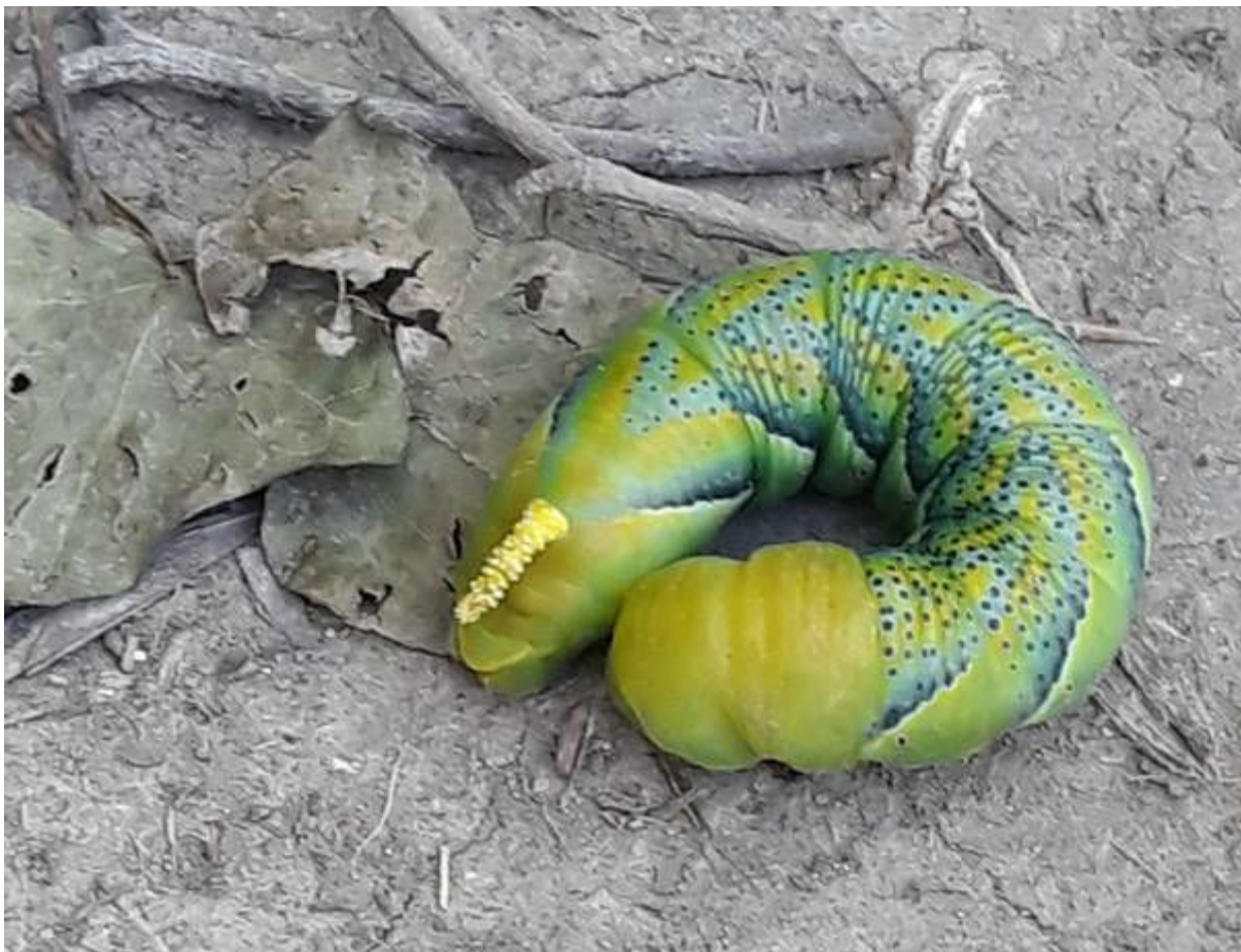
Acherontia atropos - Sphingidae Le Sphinx tête de mort Chenille Lieu : Lattes 05-06-2020