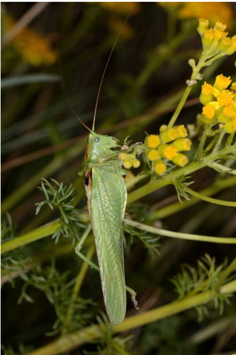
Tettigonia viridissima - Tettigoniidae sur Senecio adonidifolia

Lieu : Lac des Pises (Dourbies-30) 01-07-2020