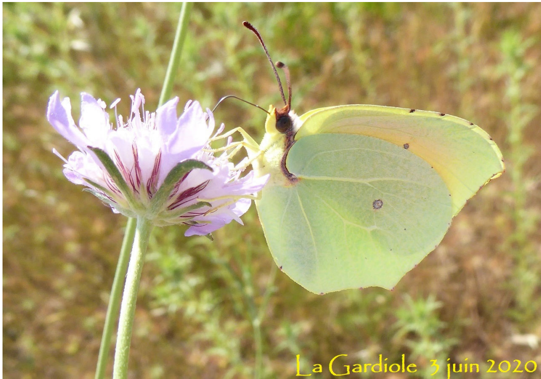
Gonepteryx cleopatra - Pieridae Le Citron de Provence mâle Lieu : La Gardiole 03-06-2020