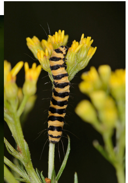
Chenille sur Senecio adonidifolia