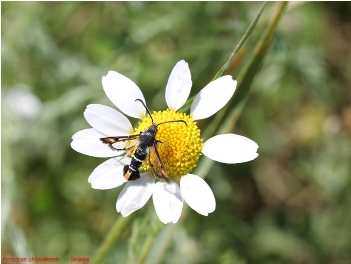
Pyropteron chrysidiformis : Sesiidae

Pyropteron chrysidiformis - Sesiidae Auteur : Marcelle Huguet Lieu : Les Blaquières 21-05-2020