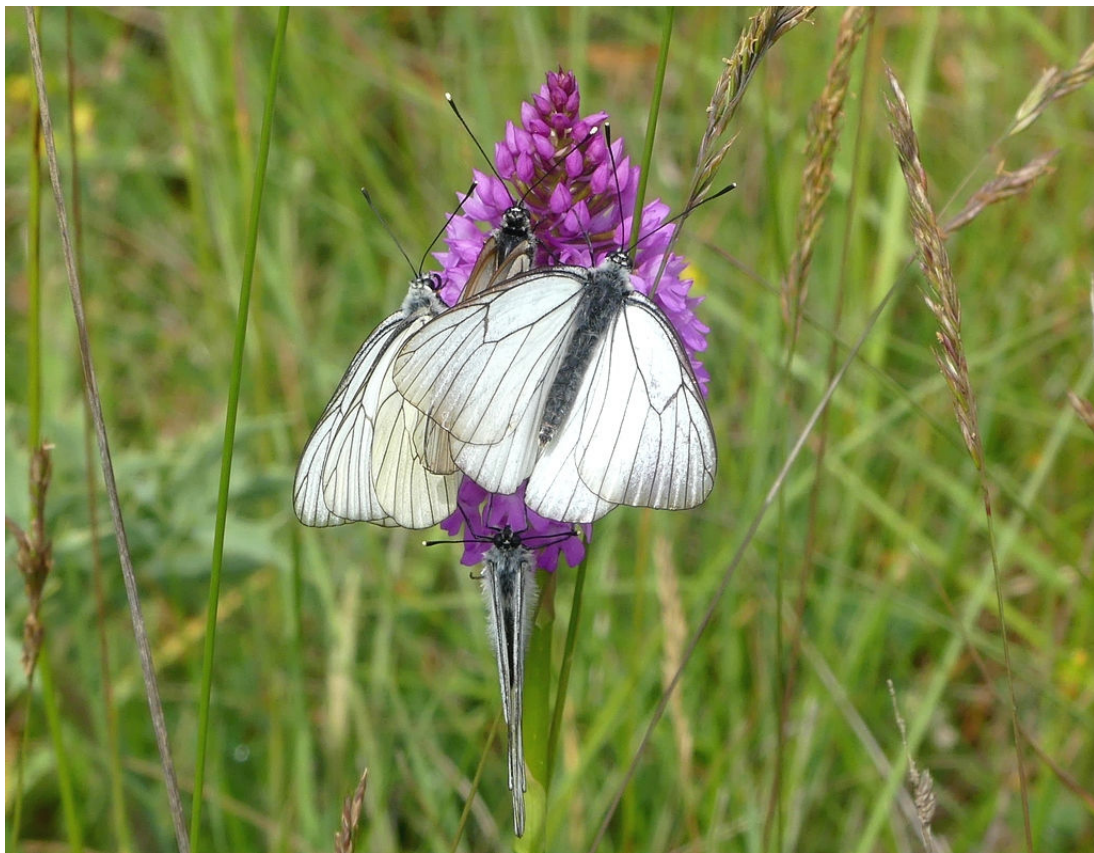
Aporia crataegi - Pieridae Le Gazé Lieu : St Martin du Larzac 09-06-2020