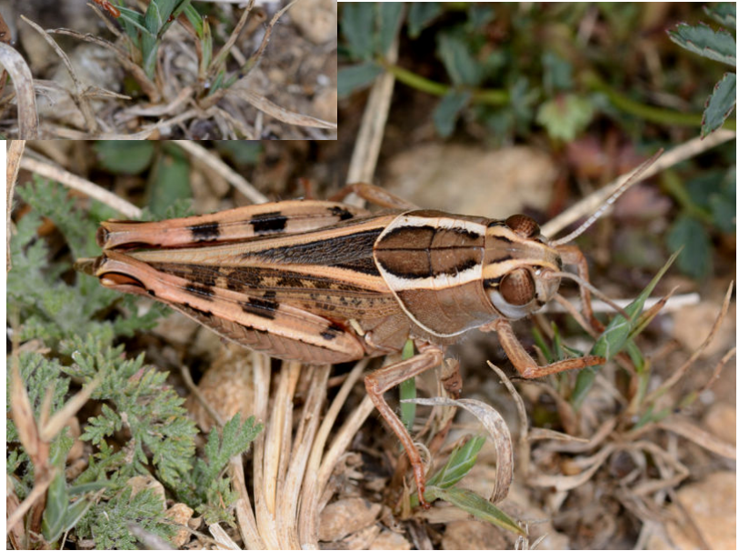
Calliptamus sp. Acrididae