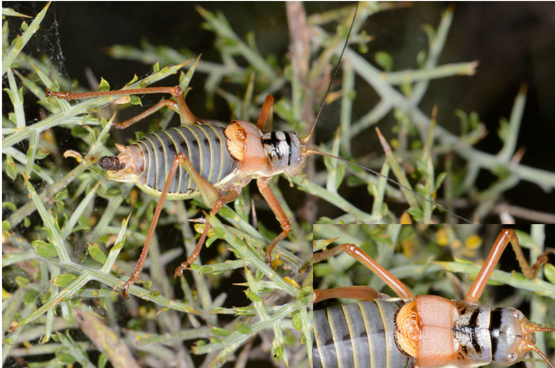
Ephippiger diurnus - Tettigoniidae

Un grand merci à Didier Morin pour l'identification de la plupart des Orthoptères et des Dermaptères qui suivront.