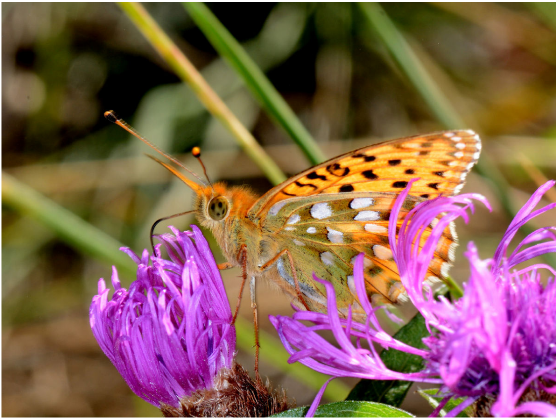
Argynnis aglaja - Nymphalidae Le Grand Nacré Lieu : Lac des Pises 19-07-2020