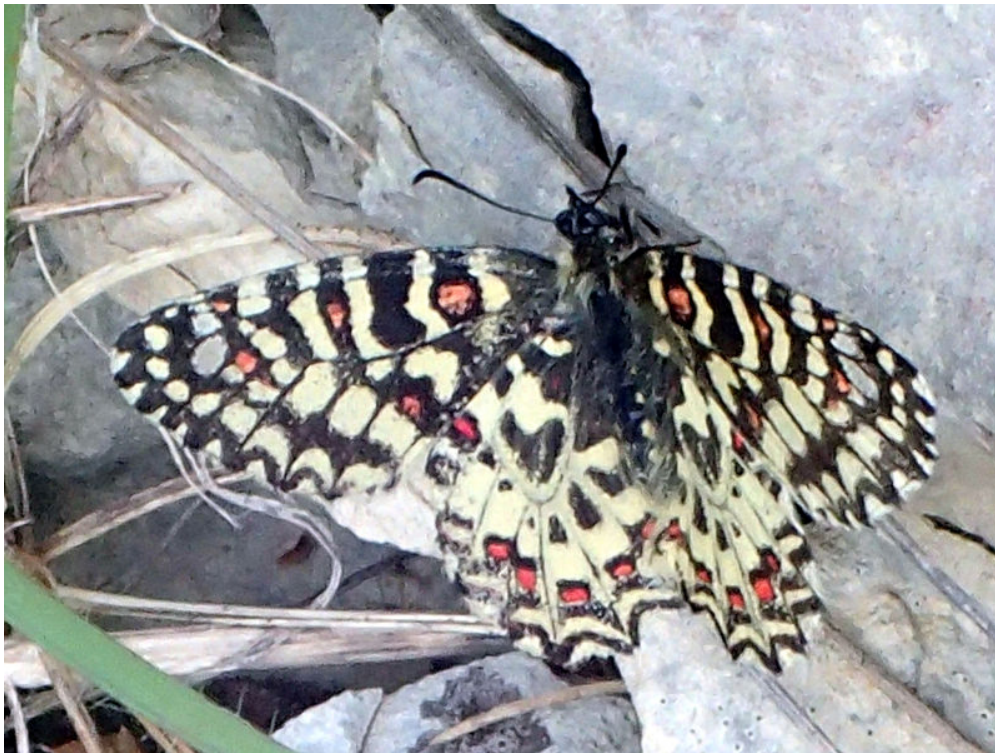
Zerynthia rumina - Papilionidae La Proserpine Auteur : DidierBasset Lieu : Claret 02/06/2020