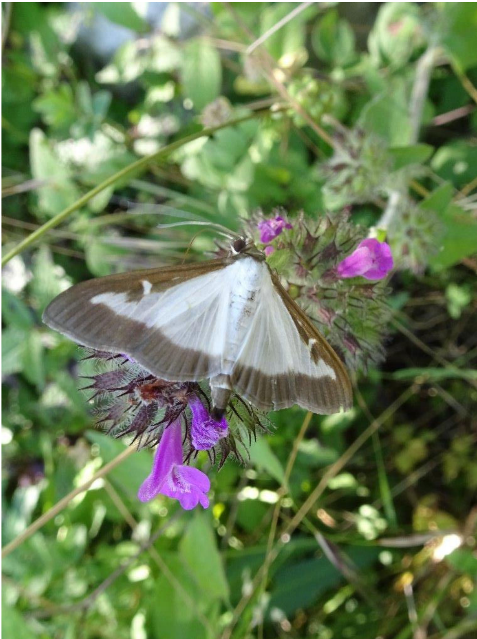
Cydalima perspectalis - Crambidae La Pyrale du buis Lieu : Madières 15-06-2020