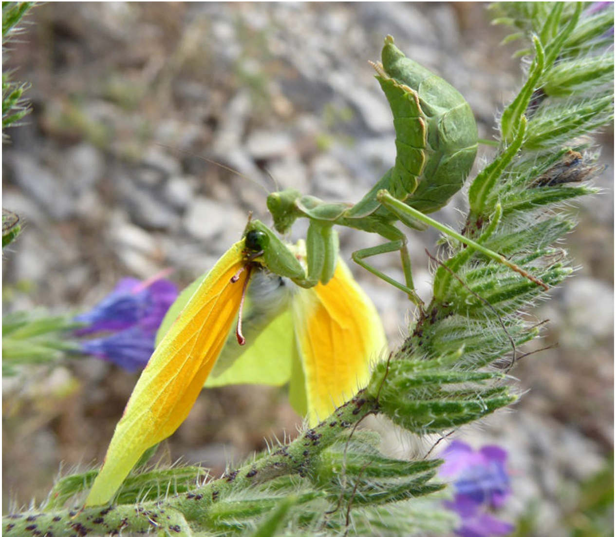
Ameles spallanzania - Mantodea - Amelidae femelle Mangeant un Gonepteryx rhamni

Auteur : Marie-Thérèse Goupil Lieu : La Gardiole 03-06-2020