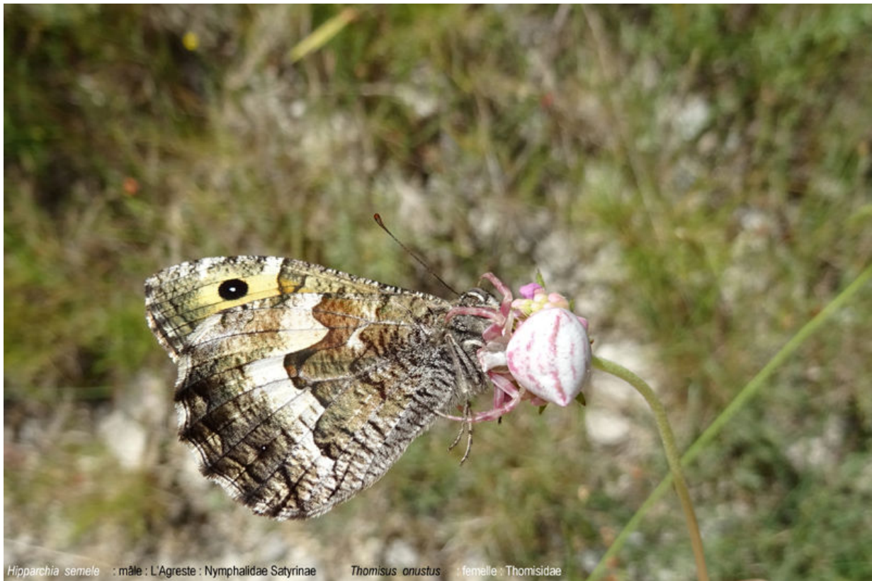
Hipparchia semele : mâle : L'Agreste : Nymphalidae Satyrinae Thomisus onustus : femelle : Thomisidae